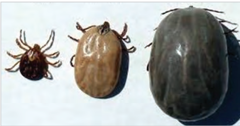
تصویر ۴- تصاویر کنه سخت که از چپ به راست به ترتیب یک، هفت و چهارده روز از بدن گوسفند تغذیه کرده است.

کنه‌ها متعلق به شاخه بندپایان بوده و به دو خانواده کنه‌های سخت و نرم تقسیم می‌شوند. الف) کنه‌های سخت: این نوع کنه‌ها در طول سال فقط یک بار تخم‌ریزی می‌کنند. فعالیت اصلی آن‌ها در ماه‌های گرم سال است. هر کنه ماده قادر است هزاران عدد تخم تولید کند. از هر تخم یک نوزاد تولید شده که در شکاف دیوارهای آغل مخفی شده و پس از مدتی خود را به بدن دام رسانده و مستقر می‌شود. این کنه‌ها در لای پشم‌ها و بیش‌تر در نواحی بدون پشم و موی بدن دام مثل گوش، کشاله‌های ران و زیر دنبه چسبیده و شروع به مکیدن خون می‌کنند (تصویر ۴).