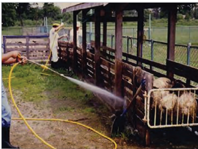
تصویر ۷- اسپری کردن گوسفند در واحدهای صنعتی

روش مناسب برای سم‌پاشی جایگاه، اسپری کردن است که با استفاده از سموم مجاز صورت می‌گیرد. توجه کنید برای سم‌پاشی، آغل خالی از دام بوده و تمامی در و پنجره‌ها به مدت ۲۴ ساعت بسته باشد.