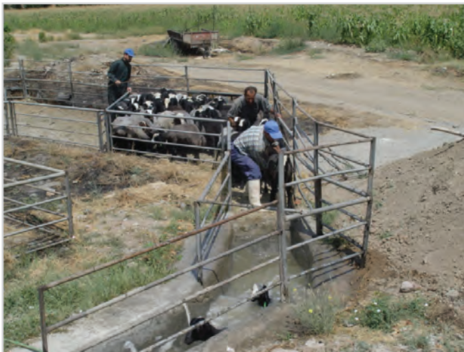
تصویر ۱۶ - تعداد دام در هر بار حمام دادن

تعداد گوسفند در هر بار حمام‌دادن بستگی به جثه، داشتن یا نداشتن پشم و تمیزی بدن گوسفندان دارد. به طور معمول در یک حمام با ظرفیت حوضچه ۶ مترمکعب آب، می‌توان حدود ۴۰۰ رأس گوسفند حدود ۴۰ کیلوگرمی تمیز را بر علیه کنه ضدعفونی کرد. پس از آن توصیه می‌شود آب حوضچه تعویض شود و برای گروه یا گروه‌های بعدی گوسفندان از آب تازه استفاده شود (تصویر ۱۶).