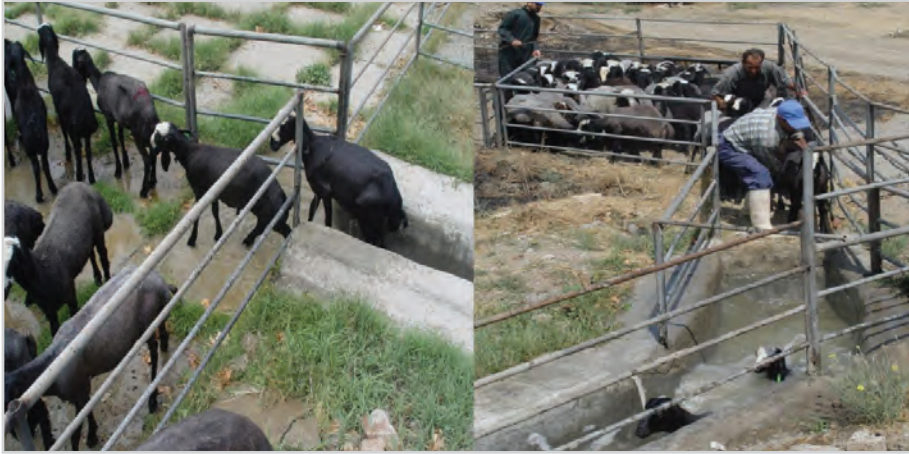
تصویر ۹- قسمت‌های مختلف یک حمام کنه گوسفند