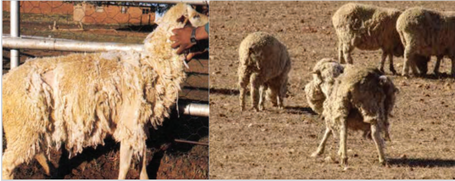
تصویر ۳- خارش بدن (چپ) و پشم ریزی در گوسفندان مبتلا به کنه (راست)