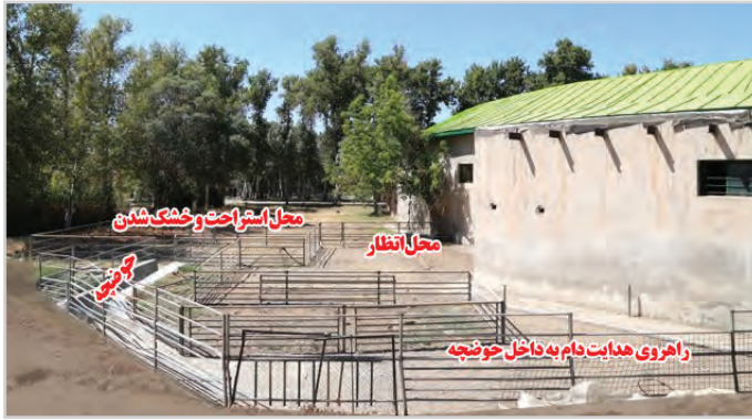
تصویر ۱۲- نمایی از چهار قسمت اصلی یک حمام ضد کنه گوسفند