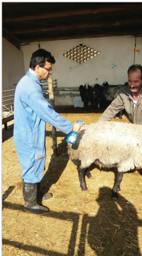
تصویر ۸- اسپری کردن دام