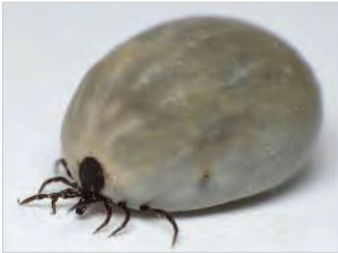
تصویر ۵- کنه نرم

ب) کنه‌های نرم: این گونه از کنه‌ها نیز همانند کنه‌های سخت پس از جفت‌گیری تخم‌ریزی می‌کنند ولی تعداد تخم‌های آن‌ها خیلی کمتر است. کنه‌های نرم در طول عمر خود چند بار تخم‌ریزی می‌کنند. این کنه‌ها روز در شکاف دیوارها بوده و شب‌ها به بدن دام می‌چسبند و بیش‌تر انگل‌پرندگان هستند (تصویر ۵).