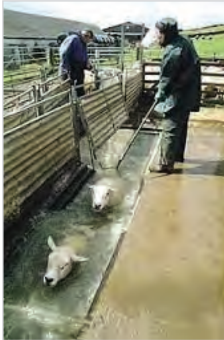
تصویر ۱۷- میله دو شاخه برای فرو کردن سر گوسفند در حوضچه آب

دامها را فشار داده تا سر آنها کاملاً در آب فرو رود. بهتر است این عمل دوباره تکرار شود. تعداد زیادی از کنه‌ها به قسمت داخلی گوش گوسفندان می‌چسبند و با فرو رفتن سر دام در آب از بین می‌روند (تصویر ۱۷).