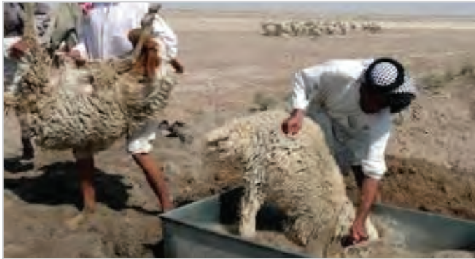
تصویر ۱۳- حمام دادن گوسفند با روش سنتی

معمول ترین شکل این نوع از حمام، که برای بیش تر واحدهای پرورش گوسفند کشور توصیه می شود، همان حمام سنتی ضد کنه است که در قسمت بالا توضیح داده شد. انواع دیگری نیز از این نوع در مناطق مختلف کشور مورد استفاده پرورش دهندگان گوسفند قرار می گیرد (تصویر ۱۳).