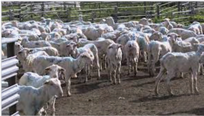
تصویر ۶- جدا کردن دام‌های آلوده

اولین قدم برای از بین بردن کنه جدا کردن دام‌های آلوده به کنه است. چنانچه کنه یا کنه‌هایی در بدن دام مشاهده شود لازم است بلافاصله دام را از گله جدا کرده و در یک جای منفرد قرنطینه کرد. بدین ترتیب از انتقال کنه به دام‌های دیگر جلوگیری می‌شود. دام‌های قرنطینه شده نباید تا درمان کامل داخل گله شوند (تصویر ۶).