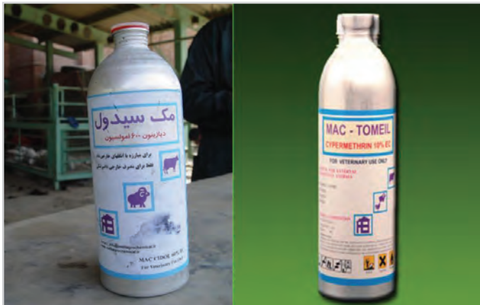
تصویر ۱۵- دو نوع سم ضد کنه گوسفند

طیف وسیعی از انواع سموم بویژه سموم فسفره برای مبارزه با انگل‌های خارجی دام به صورت اسپری و حمام ضد کنه استفاده می‌شود. نکته مهم به هنگام استفاده از این سموم رعایت دقیق دستورالعمل کاربردی آنهاست که لازم است براساس آن اقدام شود. تعدادی از این سموم عبارتند از: بایتیکول پوران (فلومترین)، پروپتامفوس (بلوتیک)، مک سیدول (دیازینون)، مک تومیل، نگوون، آزانتول مالاتیونو پاراتیون، بایگون و لیندن (تصویر ۱۵).